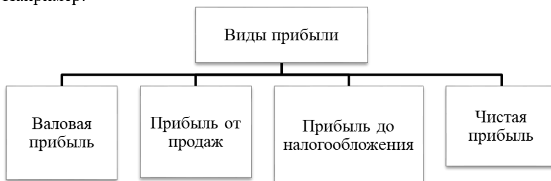
Рисунок 1 – Виды прибыли

Каждый рисунок должен сопровождаться содержательной подписью, которая размещается под рисунком в одну сторону с номером. Название рисунка всегда начинается с прописной буквы, Times New Roman 14, без точки в конце. Например: